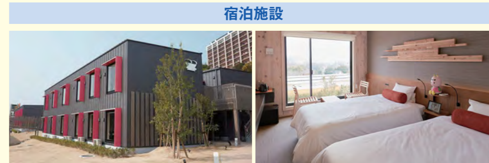
ハウステンボス「変なホテル」2期棟【長崎県】