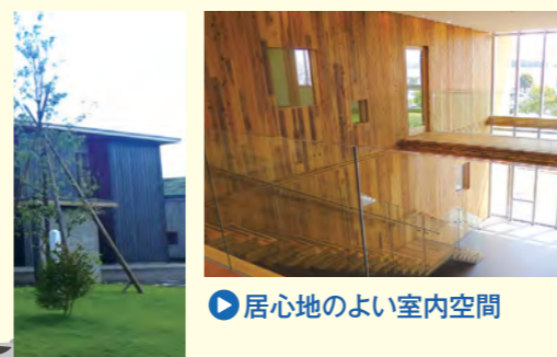
居心地のよい室内空間

● 3階建て以下の共同住宅や学校等(※1)について、防火被覆なしで木目を活かした建築が可能です。 (※1) 準耐火構造までの建築物であれば、防火被覆なしで使用できます。建物の用途などにより、3階建て以下でも防火被覆が必要になる場合があります。