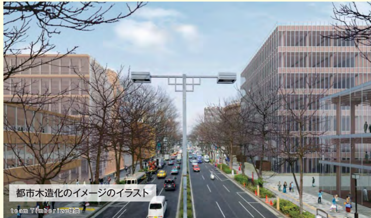
都市木造化のイメージのイラスト