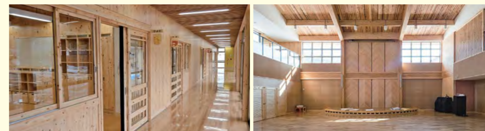
真庭市立北房こども園【岡山県】