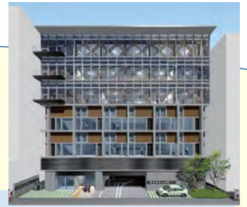
高知県自治会館新庁舎 ○3FまでRC (鉄筋コンクリート) 造 ○4~6Fは木造軸組+CLT