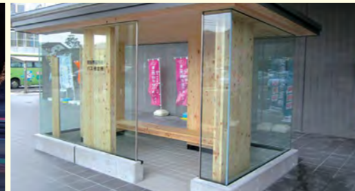
真庭市バス停【岡山県】