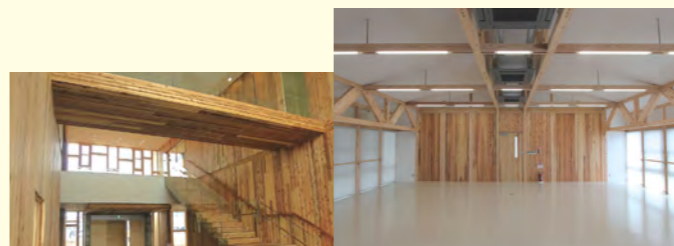
木造軸組とCLTによる 広い室内空間