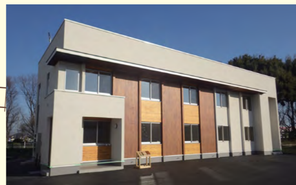
三井ホームコンポーネント(株) 事務所【埼玉県】