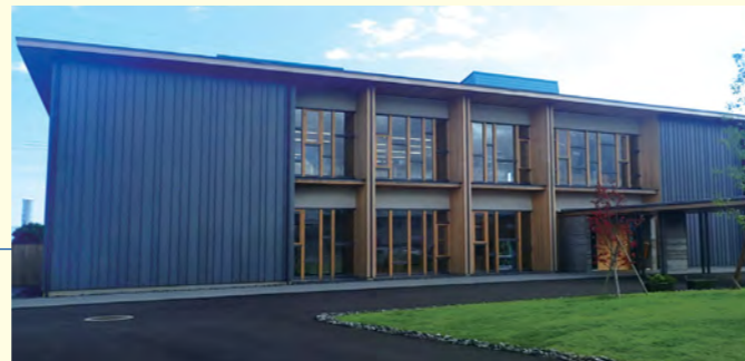
高知県森林組合連合会事務所【高知県】