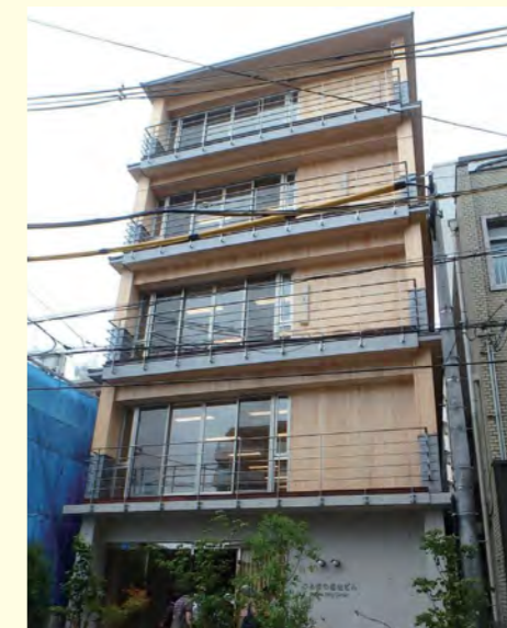
ぷろぼの福祉ビル【奈良県】

● 1階を鉄筋コンクリート、2階~5階をCLTパネル工法とすることで5階建てが実現!