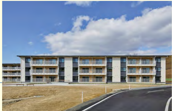
いわきCLT復興公営住宅【福島県】